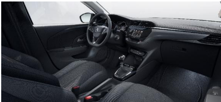
Komfortné sedadlá, látkové čalúnenie čierne Fresez, sedadlo vodiča nastaviteľné v 6 smeroch (BPFX) 0 €