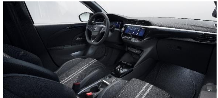
Látkové čalúnenie Banda, čierne s bielymi pruhmi, športové tvarovanie sedadiel (D4FV) 0 €