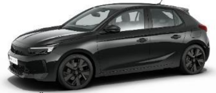
Čierna Karbon (9VM0) 500 €