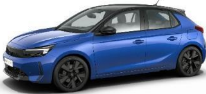
Modrá Voltaik (AVM0) 500 €