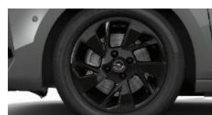
16" čierne disky z ľahkej zliatiny (ZHL5)