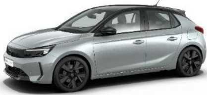
Strieborná Kristall (ZRM0) 0 €