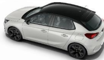
Čierna strecha Diamond Black (JD20) GS štandard