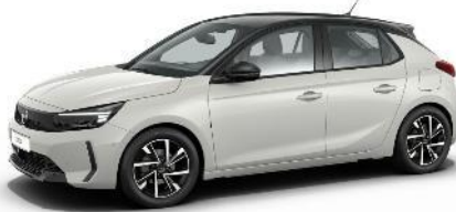
Biela Arktis (WPP0) 250 €