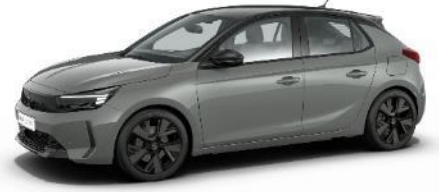
Šedá Grafik (SDP0) 500 €