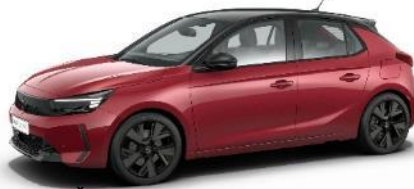
Červená Kardio (PQM0) 500 €