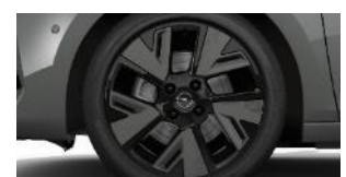
17" čierne disky z ľahkej zliatiny s výbrusom Diamond Cut (ZHQW)